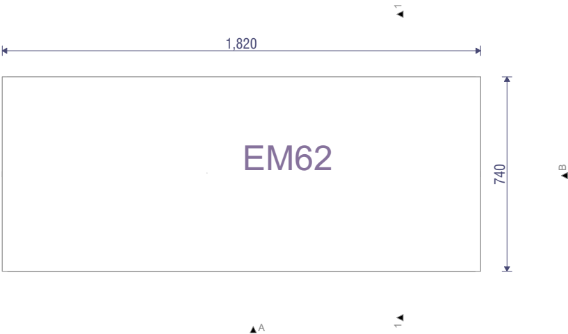
PLAAN ALGKOOLI JALATSIKAPP 1:20